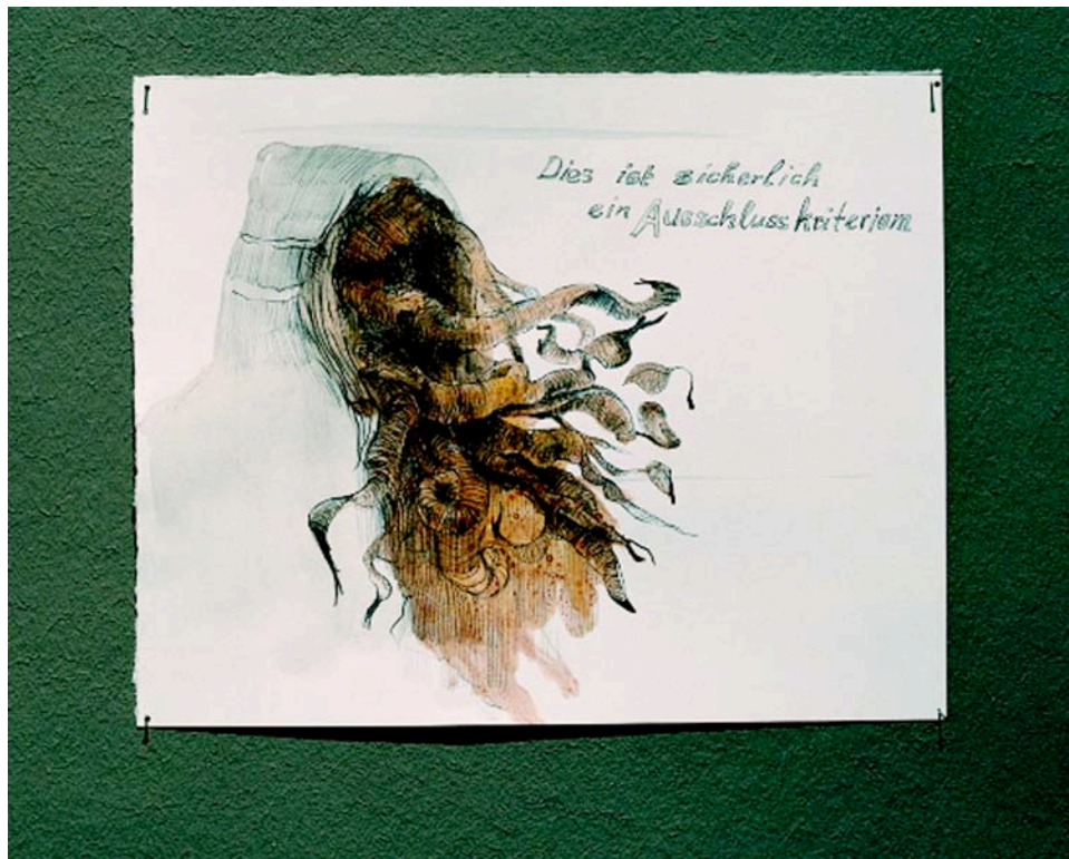
Abb. 2: Ins A Kromminga, Ausschlusskriterium (criteria for rejection), Bleistift, Aquarell auf Papier, 16 X 23 cm, 2007

Das ist eine Zeichnung von Ins A Kromminga, die „Ausschlusskriterium (criteria for rejection) heißt - Bleistift, Aquarell auf Papier, 16 X 23 cm, 2007“. 14 Ich zitiere hier Krommingas Arbeit, um Sie an genau jene Dimension von queer zu erinnern, für die das Wort queer im ersten, älteren Wortsinn herhält: merkwürdig, eigenartig, bis hin zu falsch und pervers, jedenfalls eine Form, oder Un_Form, oder etwas Un_formendes bezeichnend, das den bekannten und vertrauten Kategorisierungen nicht so ohne weiteres entsprechen will – und dennoch mit ins Haus will, oder mehr noch, längst schon im Haus anwesend ist.